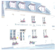
Façade du restaurant

Nous vous remettons les clés et vous accompagnerons jusqu'aux chambres (10 mètres du restaurant).