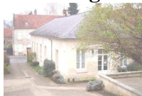
Les 4 chambres sont situées dans cette maison sans étage

Dans la cour, sur votre gauche , se trouve une maison.