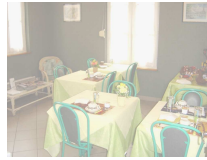
Salle des petits déjeuners

Le petit déjeuner sera mis à votre disposition sur votre table, dans la salle des petits déjeuners située à l'entrée des chambres.